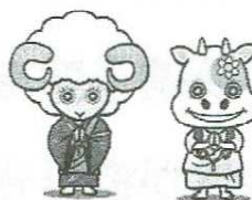
めぞメェくん・あゆモッチマン

山陽教区教化委員会社会問題部門 お問い合わせ 真宗大谷派（東本願寺）山陽教務所 TEL : 079-292-3690 FAX : 079-292-1747 メール : sanyo@higashihonganji.or.jp H P : http://www.sanyo-kyoku.jp/wp/