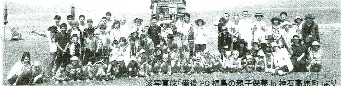
※写真は「備後 FC 福島の親子保養 in 神石高原町」より

多くの皆様のご参加を心よりお待ちしております。共に学びあっていきましょう。そして、広島・ハンセン病・阪神淡路・福島のこと、これからも考え続けていきましょう。